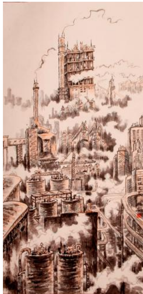
厂区一隅 国画 解鹏建

与书为伴吧,如和伦敦查令十字街84号结下情缘的美国女作家海莲一样热爱书吧。因为有书,可以让生至死不孤独,而含笑以终。