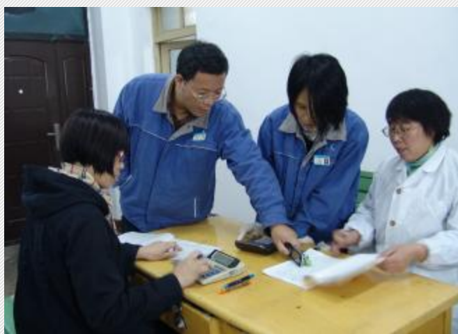
近日,技术中心举办职业道德培训,通过典型案例和职业道德课件学习,教育全体员工保持廉洁从业和勤勉敬业的良好风气,真正当好氧化铝生产的“眼睛”和“参谋”。图为技术中心员工正在讨论学习课件。